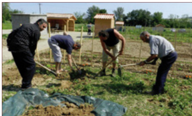
Jardin Bartaulo de Bessières - Atelier de jardinage écologique