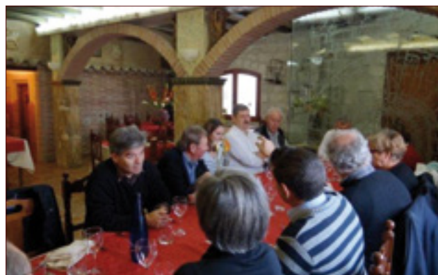
Échanges conviviaux de nos délégations - 9 novembre 2012.

La réflexion commune, la mutualisation d'expériences, le débat et l'ouverture de ce type de projet dépassent très largement le cadre communal ou intercommunal et prennent ici leur pleine mesure.