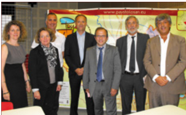
Table ronde salon de la Mobilité «Bougez autrement en Pays Tolosan»

Lors de cet échange les acteurs de la mobilité qui imaginent et préparent notre mobilité future étaient réunis :