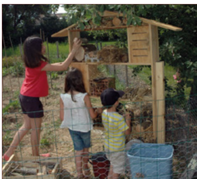
Jardin ici et Maintenant - Montberon : création hôtel à insectes

La 7 e édition des Journées Natures Midi-Pyrénées organisée par le Conseil Région s'est déroulée du 26 mai au 3 juin 2012.