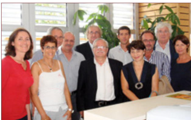
La délégation du Pays Tolosan lors de la visite de la MSP Castelnau Magnoac.

Une délégation du Pays Tolosan est allée visiter la Maison de Santé Pluridisciplinaire à Castelnau Magnoac (Pays des Coteaux- 65) en septembre 2012 pour se rendre compte des services apportés par cette structure et des exigences demandées pour la réalisation de cet équipement.