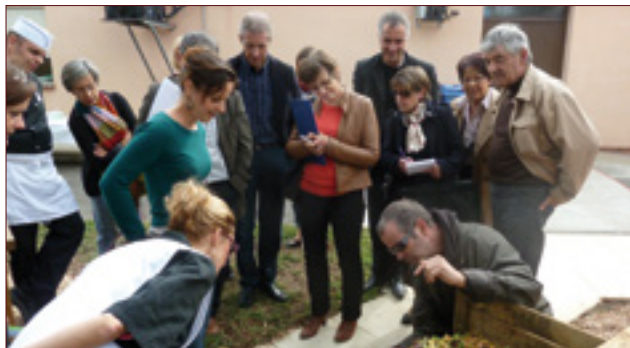
Visite site pilote de Fenouillet - Compostage en restauration collective

• Visite du site pilote de compostage dans la restauration collective à Fenouillet : le 17 octobre 2012.