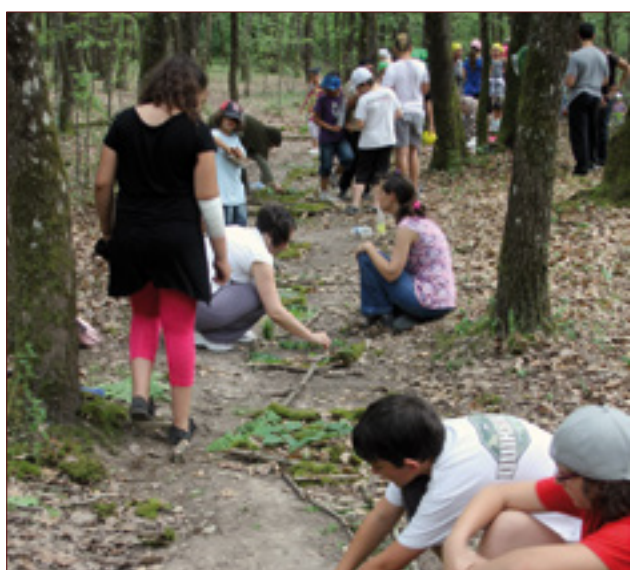
Conseil Municipal des Enfants et des Jeunes de Vacquiers - Landart