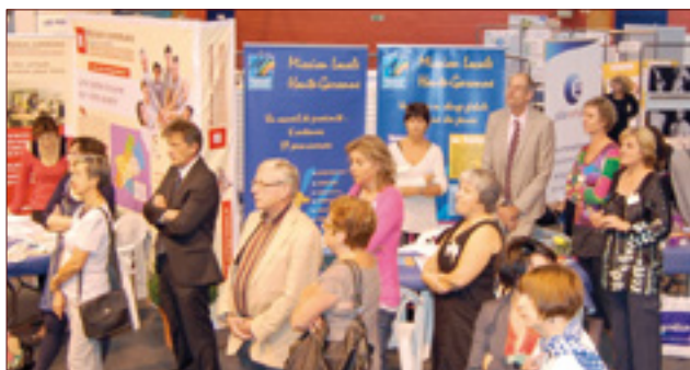
Forum social : vue de quelques stands d'information - 6 octobre 2012.

• Le 6 octobre, à Boulac tenue du forum social. Ouvert au public en présence d'une cinquantaine de partenaires qui ont animé des stands proposant une prise de contact ou des rencontres individualisées sur les thèmes de l'emploi, insertion, formation, services à la personnes, enfance, adolescence, personnes âgées, prévention, santé, précarité, accès au logement, assistance juridique