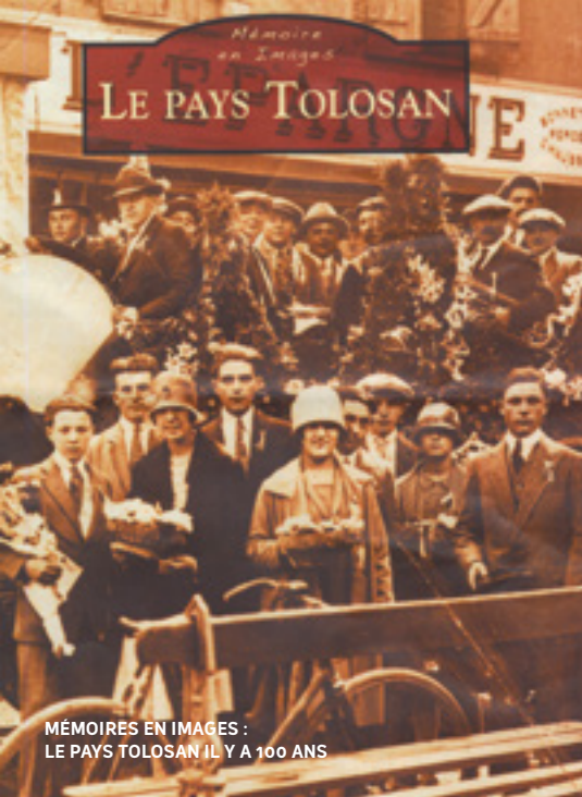
MÉMOIRES EN IMAGES : LE PAYS TOLOSAN IL Y A 100 ANS